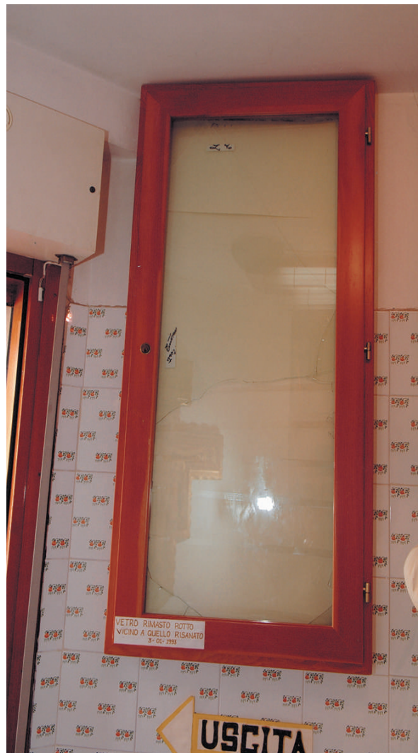
Vetro rimasto rotto vicino a quello risanato 3 gennaio 1993